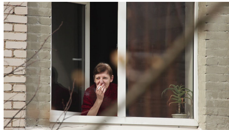
Mēnešiem gara diena [20', 2020] rež. Rūdolfs Deinats

Filma vēsta par divām paralēlām pasaulēm: notikumiem, ļaudīm un kaimiņiem aiz loga, pagalmā, kā arī notikumiem režisores dzīvoklī, kas tiek fiksēti skaņas ceļiņā. Pretstatot šīs vides, atklājas, ka daudzus notikumus var viegli palaist garām.