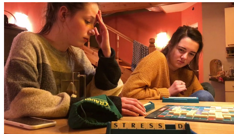
Sapņu pavasaris [31', 2020] rež. Rūta Znotiņa

Filma atspoguļo tās autora iekšējo metamorfozi karantīnas laikā. Bez dialogu un teksta palīdzības tā ataino smalko robežu starp sadzīvi, mistifikāciju un fakta interpretāciju. Neko citu atainot filma nepretendē – tā ir konkrētos brīžos ieslēgta kamera.