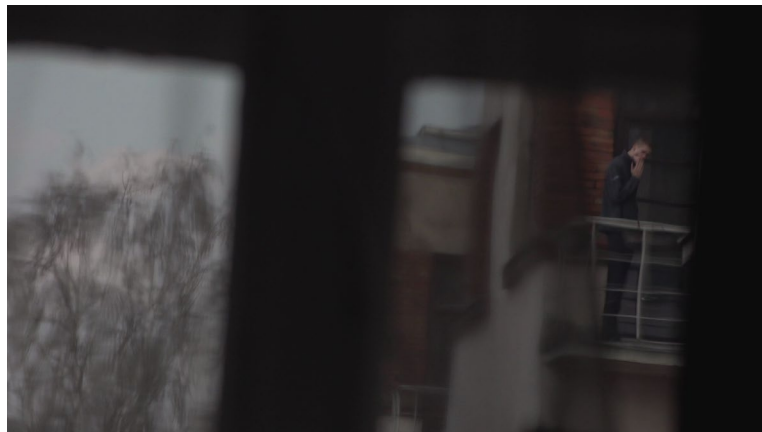
Pagalma piezīmes [11', 2020] rež. Anete Dance

Filma vēsta par divām paralēlām pasaulēm: notikumiem, ļaudīm un kaimiņiem aiz loga, pagalmā, kā arī notikumiem režisores dzīvoklī, kas tiek fiksēti skaņas ceļiņā. Pretstatot šīs vides, atklājas, ka daudzus notikumus var viegli palaist garām.