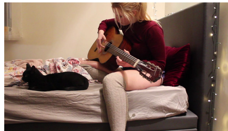
Un nekam citam nav nozīmes [12', 2020] rež. Monta Bubuče

Filma, kas sadalīta trīs nodaļās, ataino Helmuta piedzīvojumus pandēmijas laikā. Helmutš nonāk pie atklāsmes, ka negaidīti radušos brīvo laiku var izmantot lietderīgi. Viņš uzņem dramatisku īsfilmu par slepkavām un izrāda to savai ģimenei.